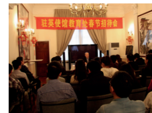
左图：2012年驻英国使馆教育处举办新春招待会。