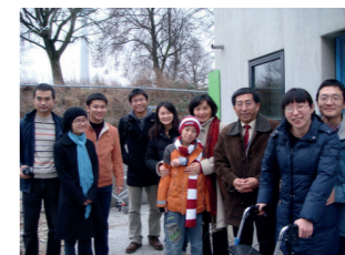
上图：驻慕尼黑总领馆教育组看望遇车祸受伤的留学生。