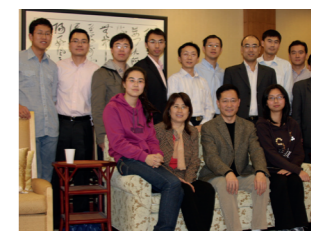
左图：2009年，驻洛杉矶总领馆教育组举办公派生联谊会并纪念中美建交30周年。